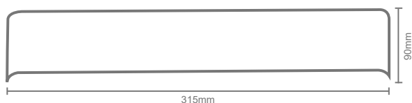
DIAGRAMA DE MEDIDAS